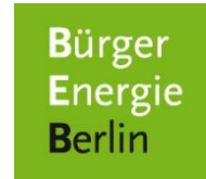
Bürgerenergie Berlin e.G.