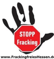
Bürgerinitiative Fracking freies Hessen