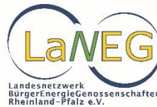
Landesnetzwerk Bürgerenergiegenossenschaft Rheinland-Pfalz e.V. (LaNEG e.V.)