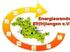
Energiewende ER(H)langen e.V.