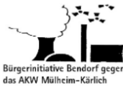
Bendorfer Bürgerinitiative gegen das AKW Mülheim-Kärlich e.V.