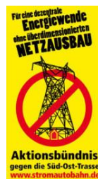
Aktionsbündnis gegen die Süd-Ost-Trasse