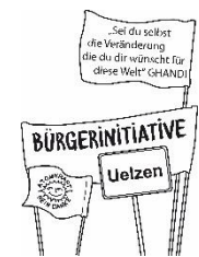
BürgerInneninitiative Umweltschutz Uelzen