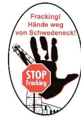
Bürgerinitiative „Hände weg vom Schwedeneck“