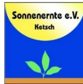
Sonnenernte e.V. Ketsch