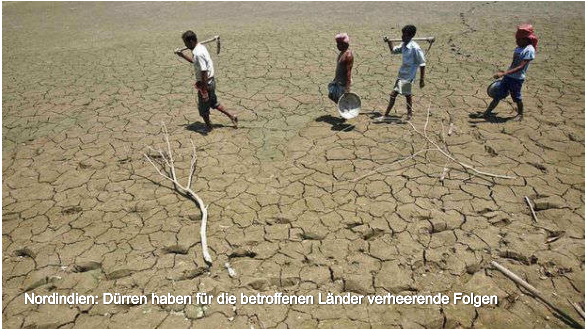
Nordindien: Dürren haben für die betroffenen Länder verheerende Folgen